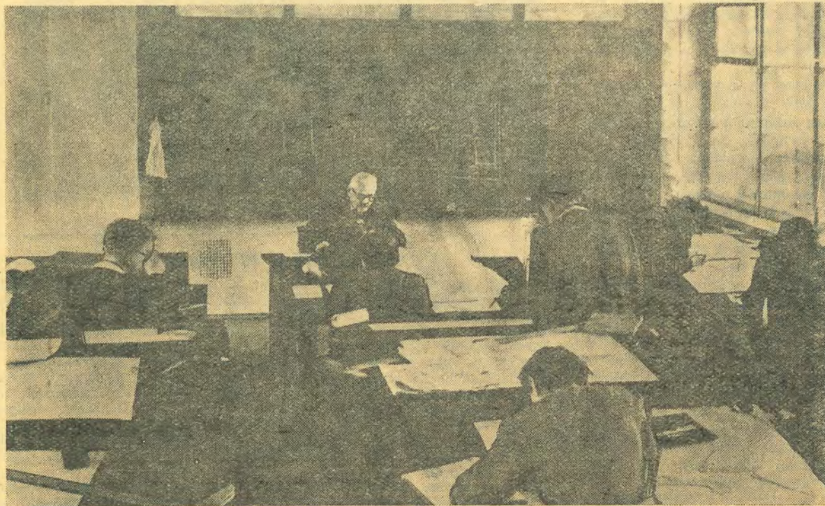
На снимке: занятия по черчению в 1-й группе первого курса факультета Вик; занятия проводит доцент М. С. Горячев.