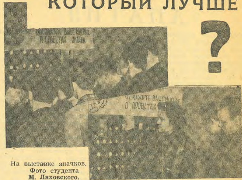
На выставке значков.

ПОЖАЛУИ, ЗА ПРОШЕДШУЮ НЕДЕЛЮ ничто не привлекало к себе большего внимания в МИСИ, чем выставка значков. С утра и до вечера на втором этаже, около стенда, толпились студенты. Пройтись к стенду было нелегким делом.