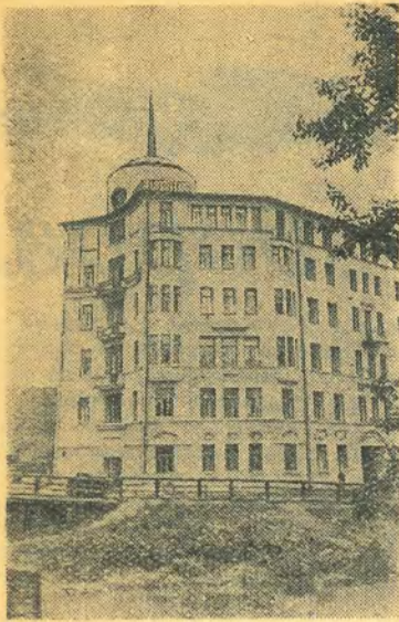
В этом доме на набережной р. Карповки состоялось историческое заседание ЦК большевиков.

Владимир Ильич Ленин ушел в штаб революции — Смольный. А. ЛЕВИКОВ, (Наш спец. корр.) г. Ленинград.