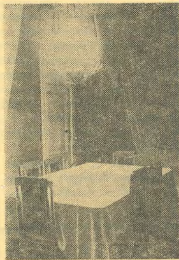
Комната, где 10 (23) октября 1917 г. была принята резолюция о восстании.

ли только двое — Каменев и Зиновьев. Троицкий формально был за резолюцию, но предложил поправку: отложить восстание до открытия второго съезда Советов. На деле это означало затянуть и заранее раскрыть врагу день восстания.