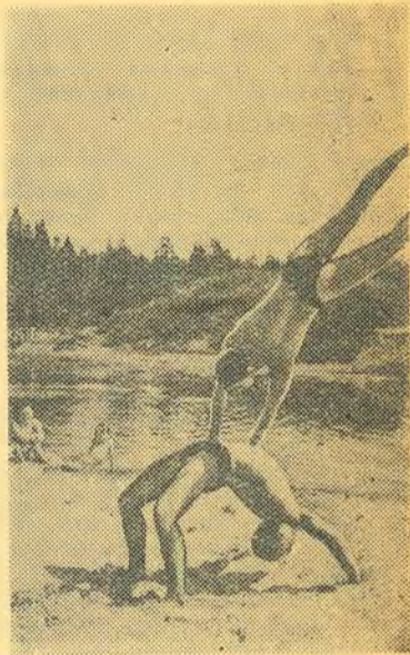
Утренняя разминка в лагере...

нался получасовой зарядкой на стадионе и водной процедурой в Дубне. После завтрака по расписанию следовала тренировка по легкой атлетике. Вместе с опытными спортсменами пробежали метать, бегали и прыгали те, кто впервые брал в руки диск и мертвал шиповки. После обеда и мертвого часа проводилась тренировка по специализации.