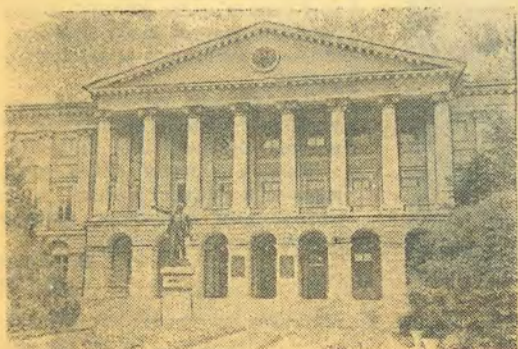
Штаб революции — Смольный.

После обмена мнениями ЦК партии принял историческую резолюцию о целесообразности и необходимости вооруженного восстания, предложенную Лениным. Против голосова-